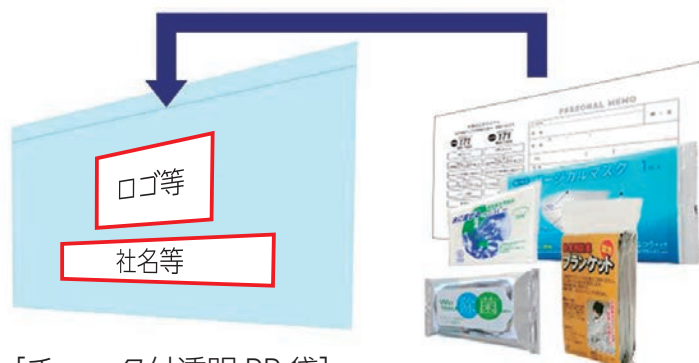
[チャック付透明 PP 袋]